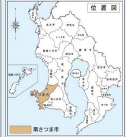
南薩地区新クリーンセンター建設工事 3工区

事業概要 側道工 L=77.0m W=4.0m 排水工 L=82m、防護柵工(GR-C-4E) L=13m 舗装工(As) A=264m 2 進入道路 L=84.88m W=6.0(8.08)m 排水工 L=161m 擁壁工 1号、2号補強土壁工(H=1.3~6.1m) L=88.23m プレキャストL型擁壁(GR基礎)(H=0.8~2.5m) L=147m 防護柵工(GR-C-2B) L=146m、舗装工(As) A=562m 2 志後道線 L=100.0m W=7.0m 排水工 L=107m、現場打ボックスカルバート(7.0×5.0) L=10m 縁石工 L=20m、舗装工(As) A=666m 2